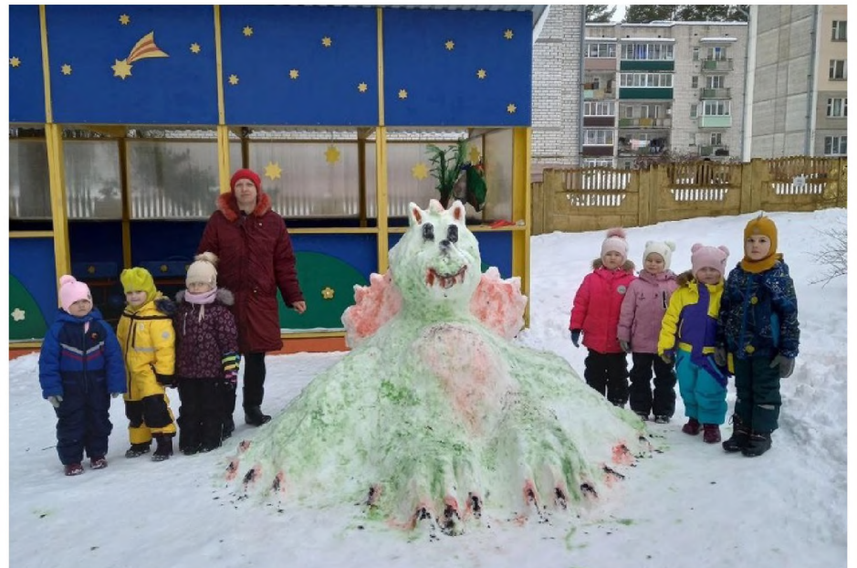
«Дракоша с Селигера»