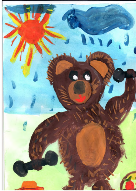
Мишка-Топтыжка по имени Силач!

С 10 по 30 ноября проводился Всероссийский конкурс детского рисунка «Персонаж здорового образа жизни» , реализуемый в рамках проекта Рос-потребнадзора «Санпросвет». Основная цель данного Конкурса - продвижение и популяризация санитарной грамотности, и формирование эпидемиологического этикета у детей и молодёжи.